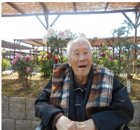
西太田祭りへ行ってきました。