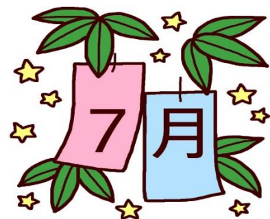
昼食は七夕特別メニュー